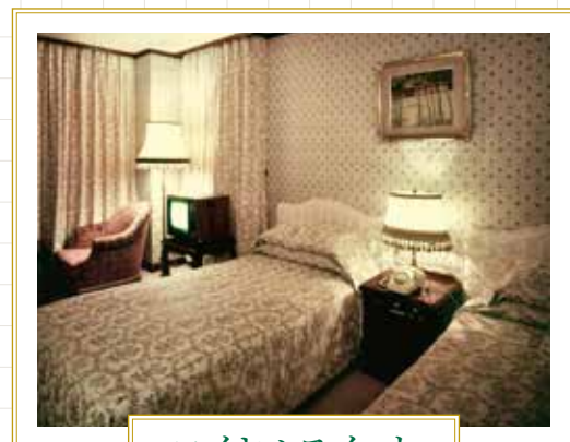
ロイヤルスイート