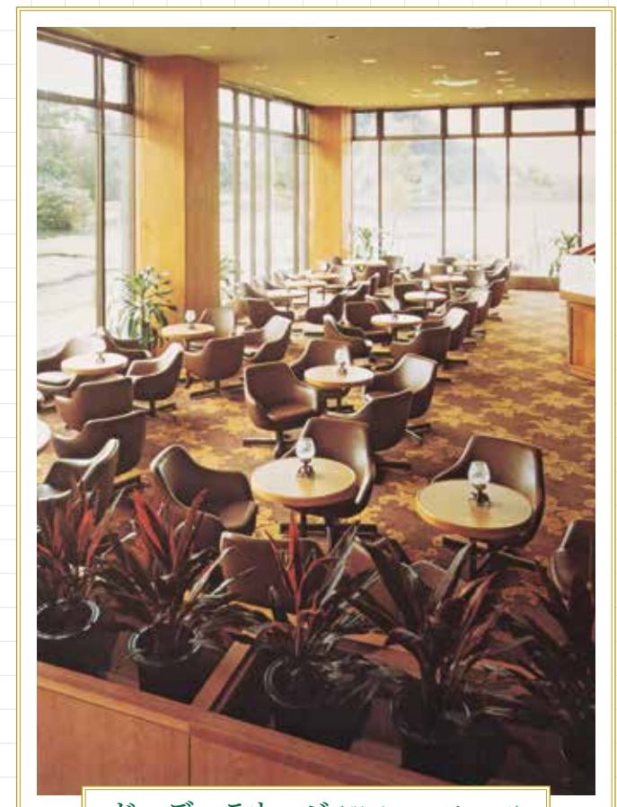
ガーデンラウンジ(現グリーンブリーズ)

佐賀を代表する格調高いシティホテルとして華やかな設えを施して開業いたしました。著名な方々をはじめ、ビジネスのお客さまやご家族の特別な日にふさわしい場として、多くの方にご利用いただいています。